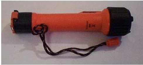
Linterna ATEX (Incluye Pilas) ref. LINTAXT